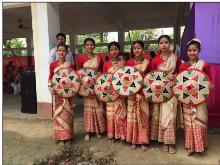
ภาพที่ 2 การแต่งกายชุดพื้นถิ่นของผู้หญิง

ผู้หญิงสวมชุดพื้นเมืองสีแดง ประกอบไปด้วย เสื้อสีแดงแขนยาว (Blouse) ผ้าที่คลุมภายนอก (Muga Riha) ผ้านุ่ง (Muga Mekhela) รวบผมตึง แต่งหน้าทาปากแดง ผ้าพาดบ่า เรียกว่า กามูซา (Gamusa) ทำจากผ้าไหมทอ หมวกทรงกรวยพื้นบ้านของฮัสสัม เรียกว่า จาปี (Jaapi) และติดเครื่องดนตรี ลาโฮลิต โกวโกวนา (Lahori Gogona) เสียบไว้กับผม ใส่เครื่องประดับกำไลเงินไว้ที่แขนทั้งสองข้าง