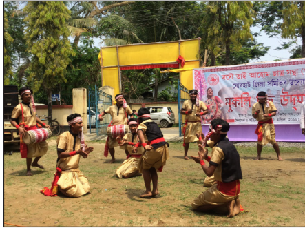
ภาพที่ 3 การแต่งกายชุดพื้นถิ่นของผู้ชาย

ผู้ชายนุ่งโสร่ง ที่ทำจากผ้าพื้นเมืองนำ กามูซา (Gamusa) คาดไว้ที่เอว โปกผ้าไว้ที่ศีรษะ หรือนำมาคล้องคอ ผูกผ้าสีแดงไว้ที่ข้อมือ