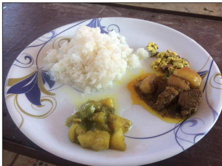
ภาพที่ 4 อาหารในเทศกาลบิฮู

อาหารประจำเทศกาลบิฮู มีทั้ง 5 อย่าง ได้แก่ ข้าวแช่ หมูสามชั้น ผัดผัก ผัดไข่มดแดงกับไข่ เหล้าที่ทำจากข้าว และมีการมอบคำอวยพรให้แก่กัน