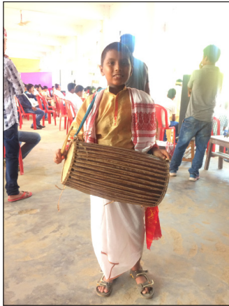
ภาพที่ 6 เครื่องดนตรี ดอล (Dhol)