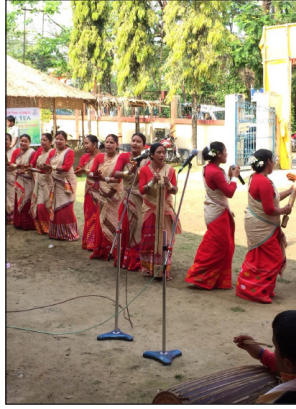
ภาพที่ 9 เครื่องดนตรี โทวก้า (Toka) (2561)

บาฮี (Baahi) มีลักษณะคล้ายเครื่องดนตรีที่พบในประเทศไทย คือ ขลุ่ย ทำจากไม้ไผ่ มีลักษณะการบรรเลงโดยการเป่า หน้าที่ของเครื่องดนตรี คือ เป็นเครื่องดนตรีบรรเลงเดี่ยว และบรรเลงพร้อมดนตรีเป็นเมโลดี้หลักของบทเพลง นิยมใช้บรรเลงกันอย่างแพร่หลายในรัฐอัสสัม เป็นเครื่องดนตรีที่มีบทบาทสำคัญในการบรรเลงดนตรีช่วงเทศกาลบิฮู