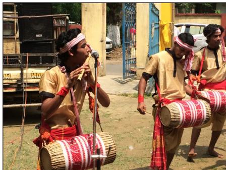
ภาพที่ 10 เครื่องดนตรี บาฮี (Baahi)

บาฮี (Baahi) มีลักษณะคล้ายเครื่องดนตรีที่พบในประเทศไทย คือ ขลุ่ย ทำจากไม้ไผ่ มีลักษณะการบรรเลงโดยการเป่า หน้าที่ของเครื่องดนตรี คือ เป็นเครื่องดนตรีบรรเลงเดี่ยว และบรรเลงพร้อมดนตรีเป็นเมโลดี้หลักของบทเพลง นิยมใช้บรรเลงกันอย่างแพร่หลายในรัฐอัสสัม เป็นเครื่องดนตรีที่มีบทบาทสำคัญในการบรรเลงดนตรีช่วงเทศกาลบิฮู