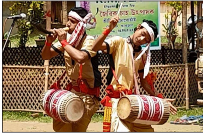
ภาพที่ 7 เครื่องดนตรี เปปา (Pepa)