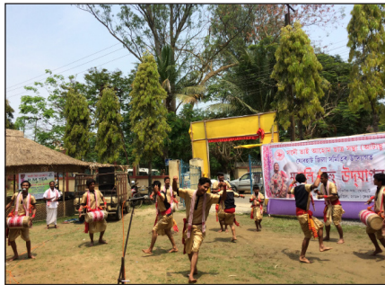
ภาพที่ 5 การแสดงบิฮูโดยผู้ชาย

นักดนตรี ซึ่งเป็นผู้ชายยืนเรียงกันในรูปแบบครึ่งวงกลม บรรเลงเพลงในรูปแบบที่คุ้นเคย มีการร้องเพลงโดยผู้ชายและผู้หญิงสลับกันร้อง และมีผู้หญิง ซึ่งเป็นคนเต้นรำเต้นอยู่พื้นที่ด้านใน เสียงกลองเริ่มเร็วและดังมากขึ้น เร่งจังหวะการเต้นให้เร็วขึ้น มีการบรรเลงเครื่องดนตรีสลับกันไปแต่ละเครื่องเพื่อให้มีบทบาทในบทเพลง ส่วนการเต้นเรียกได้ที่ใช้แทบทุกส่วนของร่างกาย ได้แก่ มือ แขน ขา เท้า สะโพก หลัง เอว มีทั้งเดินหน้า ถอยหลัง หมุนตัว กำมือ แบมือ ผู้แสดงร้องรำทำเพลงกันอย่างสนุกสนาน แม้แต่ผู้ชมเองก็อดไม่ได้ที่จะขยับตัวไปตามสัญชาตญาณ สร้างความเพลิดเพลินให้แก่ผู้ชมได้เป็นอย่างดี