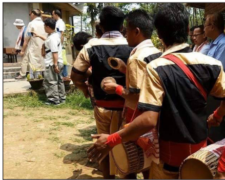
ภาพที่ 11 เครื่องดนตรี ทอล (Taal)

ทอล (Taal) คำนี้มาจากคำภาษาสันสกฤต หมายถึงการตบมือ เป็นส่วนหนึ่งของดนตรีและวัฒนธรรมของอินเดีย มีลักษณะเดียวกันกับเครื่องดนตรีที่พบเห็นในประเทศไทย เรียกเครื่องดนตรีนี้ว่า ฉาบ ซึ่งใช้ในประเพณีดั้งเดิมต่าง ๆ ทำจากทองเหลือง มีลักษณะการบรรเลงโดยการตี วิธีบรรเลง คือ นำมาตีประกบกัน จะเกิดเสียงที่ดังและอยู่ในโทนเสียงแหลม เมื่อบรรเลงร่วมกับวงดนตรีจะให้ความรู้สึกน่าเกรงขาม ศักดิ์สิทธิ์ หน้าที่ของเครื่องดนตรี